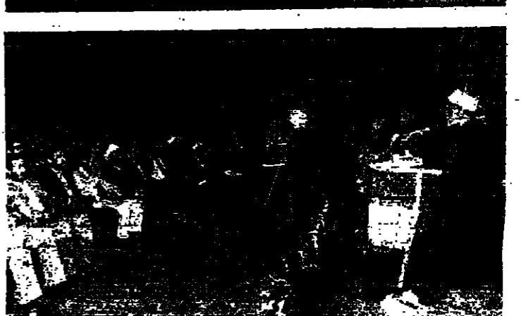
شمس الدين يقلي كلمته في المهرجان

لمناسبة الذكرى السادسة لانتصار الثورة الاسلامية الايرانية اقيم مهرجاناً في سيماء كوكوكو بعد ظهر امس تكلم فيه على التوالي الشيخ زكريا غنور، القاص ياسع الجهوري، الجمهورية الايرانية الاسلامية في بيروت السيد محمود نوراني، ونائب رئيس المجلس الاسلامي الشيعي الاعلى سماحة الشيخ محمد مهدي شمس الدين. وقد عدد الخطباء منجزات الثورة الايرانية، وشهدوا على دور المقاومة الوطنية في الجنوب. واكد شمس الدين في كلمته على ان المقاومة الوطنية ليست وجهاً مذهبياً او مسيحياً، وانما هي عطية من اجل التحرير.